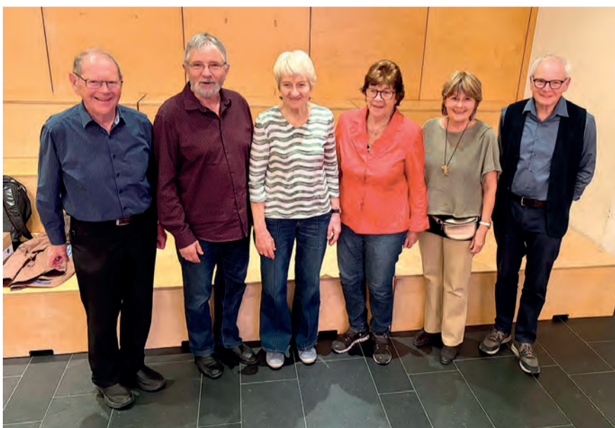
Applaus für die Geehrten an der Generalversammlung des Fördervereins des Paul Gugelmann-Museums.