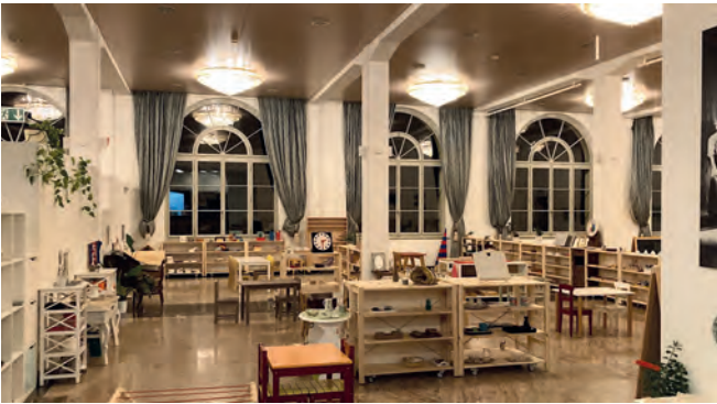
Schulzimmer für die Altersstufen 3 bis 6 Jahre (Bild links) und 0 bis 3 Jahre im Ballyhouse in Schönenwerd (Bild rechts).

Schönenwerd erhält eine neue Bildungseinrichtung: Die Schule, die nach dem Konzept Maria Montessoris aufgestellt ist, durfte am 7. Januar ihre Eröffnung feiern. Die Einrichtung richtet sich an Eltern von Kindern bis 6 Jahren.