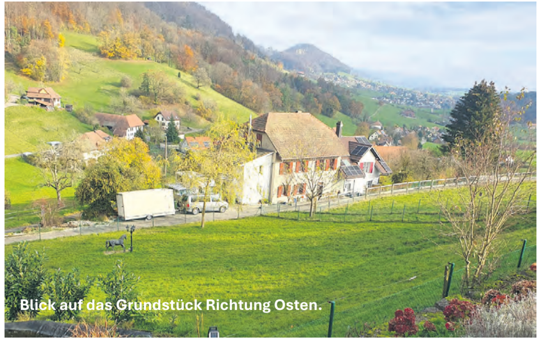
Blick auf das Grundstück Richtung Osten.

In 4654 Mahren-Lostorf planen wir eine kleine Siedlung mit kleinen Wohnperlen und kleinem Fussabdruck. Viel Zuhause auf wenig Raum!