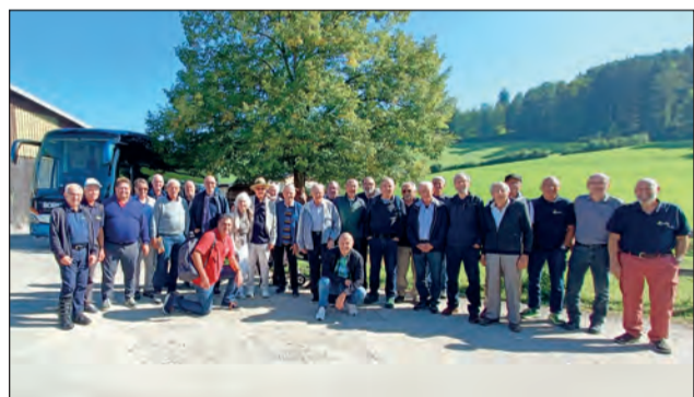
Männerriege Lostorf bei den drei Weihern in St. Gallen.