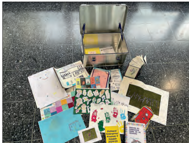
Die «Zeitkapsel» mit den vielfältigen und kreativen Beiträgen der Dulliker Schülerinnen und Schüler.

Seit April 2024 laufen in Dulliken die Bauarbeiten für den Neubau des Schulhauses «Langmatt 2» und des Kindergartens «Gassacker».