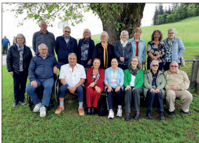
Jahrgänge 1948 und 1949