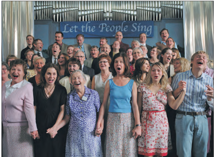
Der Chor tritt auch in Österreich auf!

Im Filmgottesdienst am Sonntagabend, 14. Januar 2024, 17–20 Uhr, in der reformierten Kirche Erlinsbach AG steht nicht die Predigt im Zentrum, sondern der Film.