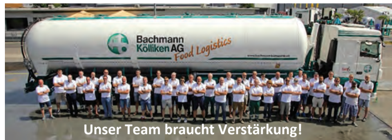
Unser Team braucht Verstärkung!

Als führender Anbieter von professionellen Transport- und Logistikdienstleistungen für hochwertige Schüttgüter zählen unsere Kunden auf Qualität, Pünktlichkeit und Sauberkeit.