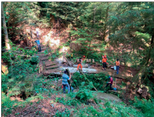
Fleissig wie die Waldameisen.

Kreischendes Motorsägegeräusch empfing die Unterhaltsequipe für den Findling im Räsgraben, Gretzenbach. Bereits zum siebten Mal innerhalb von gut vierzig Jahren wurden von der Mitte-Partei anfangs Juni Freiwillige für die Reinigungs- und Instandstellungsarbeiten am und rund um den Findling gesucht. Seit der letzten Aktion 2015 waren die Spuren der Natur und Umwelteinflüsse deutlich sichtbar. Kreuz und quer lagen einige vom Sturm «Burglind» entwurzelt Bäume über dem Räsgraben und machten den Zugang unmöglich. Dieses «Mikado» an Stämmen musste zuerst mit der Motorsäge und einer Zugmaschine fachmännisch beseitigt werden.