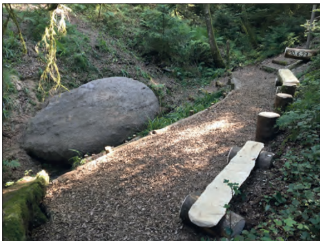
Bänkli und Holzrugel wurden an Ort und Stelle hergestellt.

Zehn freiwillige Helferinnen und Helfer sorgten mit ihrem Arbeitseinsatz einmal mehr dafür, dass der Findling im Räsgraben für Interessierte wieder zugänglich gemacht wurde.