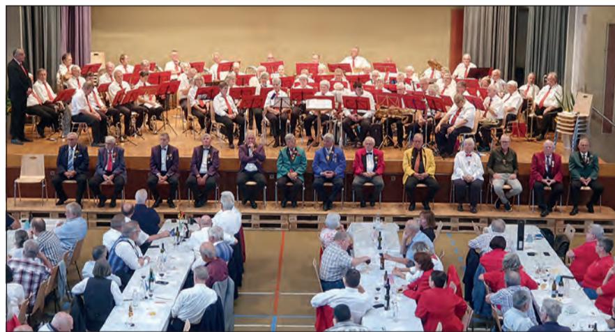
Kantonale Ehrenveteranen und Ehrenveteraninnen 2023