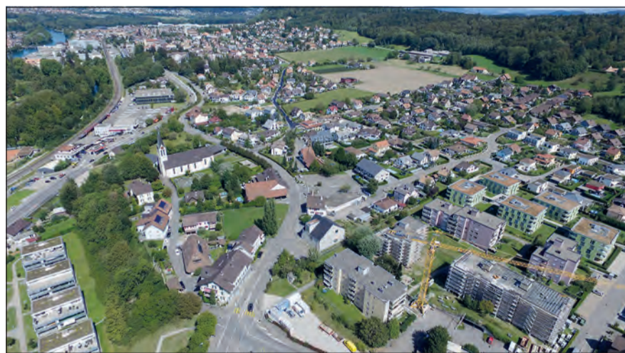
Geplant sind rund 200 Einwohner mehr als aktuell

Während 30 Tagen kann die Bevölkerung sich dazu äussern.